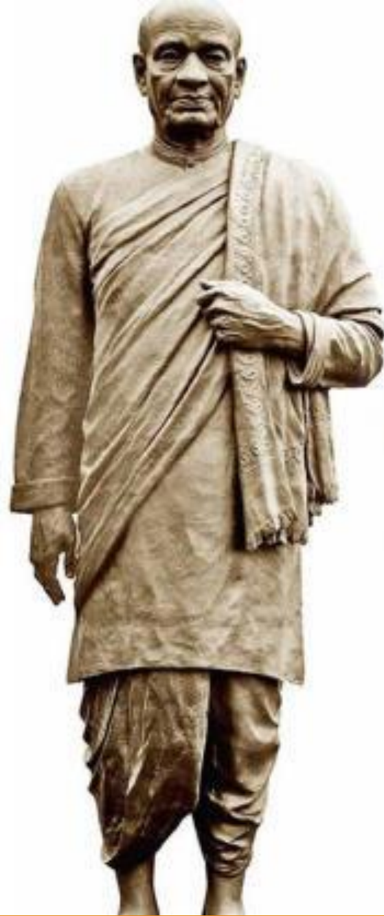
Statue of Unity - Sardar Vallabhbhai Patel